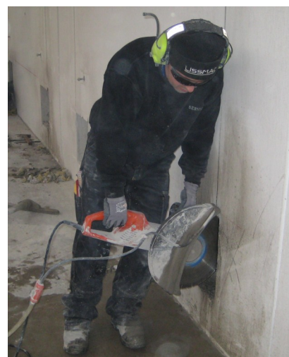
Remzi håndværker fra M. Niemann Diamantboring

Anbefalet ørekopper PELTOR OPTIME III Dæmper 40 dB